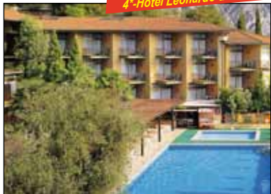
4*-Hotel Leonardo da Vinci

Reise im 3-oder 4-Sterne Fernreisebus. 5mal Übernachtung/ All-inclusive. Ausflug Gardasee mit Reiseleitung. Kurtaxe. Taxi-Service. SIP – das Sicherheitspaket.