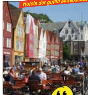
Hotels der guten Mittelklasse

Reise im 4-Sterne Fernreisebus und Schiff. 6mal Übernachtung, Frühstücksbuffet und Abendessen in den Hotels. 2mal Übernachtung, Frühstücks- und Abendbuffet auf dem Schiff. Stadtführungen in Oslo und Bergen. Passage mit „Havila“ von Florø nach Bergen. Alle innernorwegischen Fähren/Tunnels. Alle fährungsbedingten Eintrittsgelder. Taxi-Service. SIP - das Sicherheitspaket.