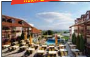
Hotel Fürstenhof ****S

Auswahl aus zwei Desserts. Bademantelnutzung. Nutzung der hauseigenen Thermen- und Badelandschaft. Nutzung der Saunalandschaft. Hauseigenes Aktiv-Programm. 10% auf Wellness-Leistungen. Taxi-Service. Kurtaxe. SKV-Stornokostenversicherung.