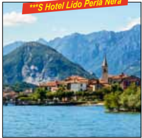
****S Hotel Lido Perla Nera

Reise im 3- oder 4-Sterne-Fernreisebus. 1mal Begrüßungsgetränk. 4mal Übernachtung/erweitertes Frühstück. 4mal 3-Gang-Menu. Ganztägige RL Borromäische Inseln. Schifffahrt zu den 3 Borromäischen Inseln. Eintritt und Führung Palast Isola Bella. Audiohörsystem Palast Isola Bella. Ganztägige RL Drei-Seen-Rundfahrt. Ganztägige RL Ortasee. Schifffahrt Orta - Isola San Giulio - Orta. Taxi-Service. SIP - das Sicherheitspaket.