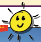
IFA FEHMARN Hotel & Ferien-Centrum****